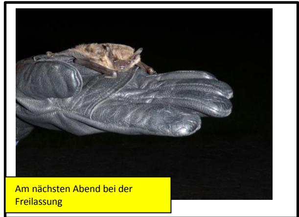
Am nächsten Abend bei der Freilassung