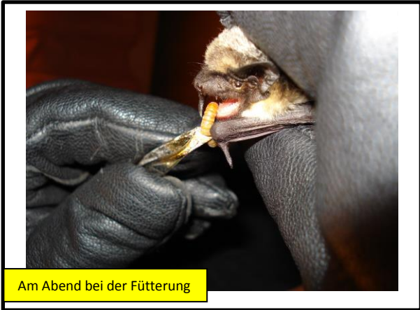
Am Abend bei der Fütterung