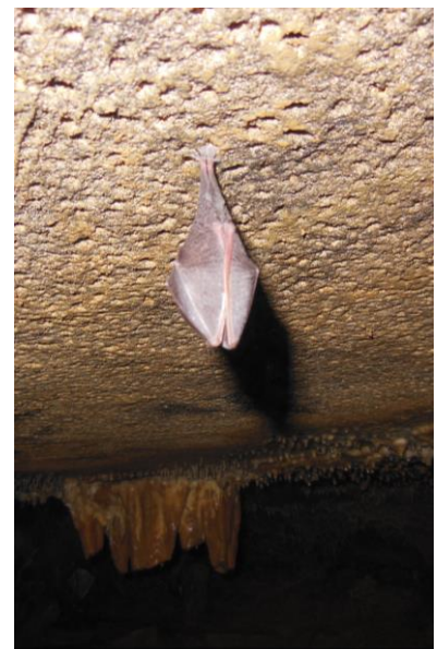
Hufeisennase im Winterschlaf

Wir sind auch dankbar für die Anregungen und Fragen unserer Leser. So haben wir diesmal das Thema Fledermäuse im Winterschlaf aufgegriffen. Es gibt Interessantes über die Pfleglinge und die verschiedenen Aktivitäten, die im Fledermausschutz stattgefunden haben zu berichten. Bald steht Halloween vor der Tür. Warum nicht einmal, statt der gruseligen, viele lustige Fledermäuse als Tischdekoration aufstellen? Viel Spass beim Lesen und Basteln wünscht euch allen das Redaktionsteam.