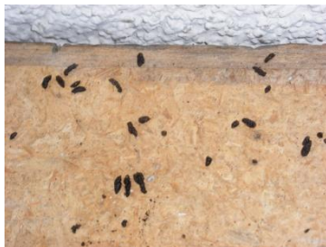
Kotspuren zeigen ein Quartier an

Wer Fledermäuse am Schlafplatz suchen möchte findet sie höchst selten. Ganz wenige Fledermäuse hängen frei sichtbar im Estrich. Viele verkriechen sich zwischen Wand und Verkleidung, im Rolladenkasten, hinter Fensterläden, etc. Sie sind dann praktisch unsichtbar.