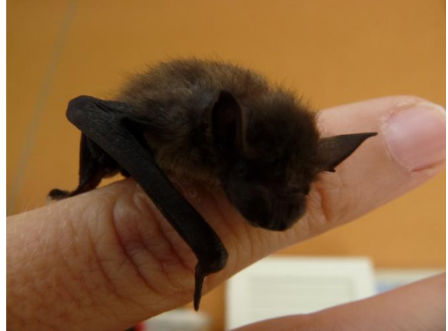
2 Wochen alte Zwergfledermaus

Der zweite Flutter-Express ist da! Es sind spannende Themen drin: Wir lesen über die jungen Fledermäuse, die zur Welt gekommen sind, über die Jagdgebiete über dem Täniker Weiher und über Fledermäuse im Stimmbruch. Ja junge Fledermäuse sehen halt so herzig drein, dass man sie einfach gerne haben muss. Vielleicht hast du dich aber schon gefragt, ob bei dir zu Hause auch Fledermäuse wohnen. Eine Kindergartenklasse zeigt dir wie du selber Fledermausquartiere finden kannst.