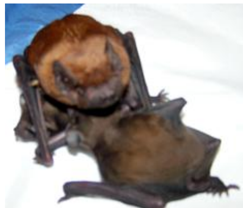
Abendseglermutter mit ihren zwei Jungen

18.5.2010 Heute beginnt mein grosser Tag. Um 14.15 Uhr wird mein Sohn geboren. Der kleine Mann macht einen so grossen Lärm, dass Trudy von Kater Filou auf mich aufmerksam gemacht wird. Sie macht mir sofort den Wärmestein bereit und setzt mich mit dem Sohn unter dem Flügel in die Wärme. Um 15.45 Uhr kommt meine Tochter auf die Welt. Jetzt habe ich aber eine anständige Pipette voller Welpenmilch verdient.