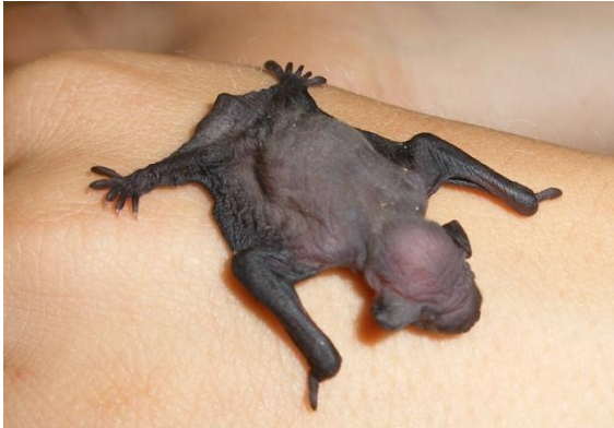
2 Tage alte Zwergfledermaus

Ende Juni hat das erste Jungtier den Weg in unsere Pflegestation gefunden. Noch in der gleichen Nacht fanden wir im Quartier aus dem sie kam, zwei weitere Junge. Sie sind frisch geboren worden. Noch nackt und blind mit Nabelschnur am Bauch haben wir sie in Pflege genommen. Nach einem ersten „Aufpäppeln“ versuchten wir die Jungen den Müttern zurückzugeben. Manchmal klappt das