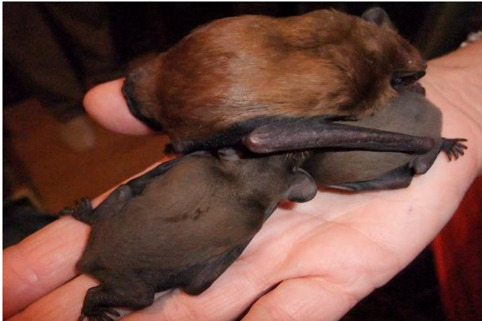
Abendseglerdame mit ihren Zwillingen

1.6.2010 Der Fototermin ist vorbei. Waren wir nicht Spitze?