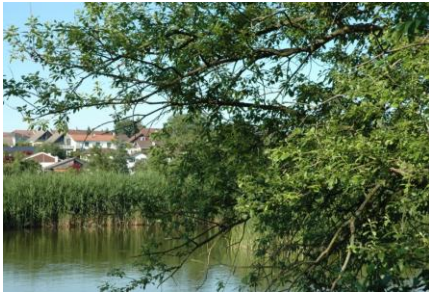
Jagdgebiet des Braunen Langohrs

fressen sie Falter, häufig sind es auch Tagfalter, die auf den Blättern die Nacht verbringen. Über dem Weiher ist es für Fledermäuse gut zu jagen, weil sich im Wasser viele Insekten entwickeln wie beispielsweise Stechmücken oder Schnaken. Weitere Insektenarten entwickeln sich im Ufergehölz und tummeln sich da zur Paarung und Eiablage.