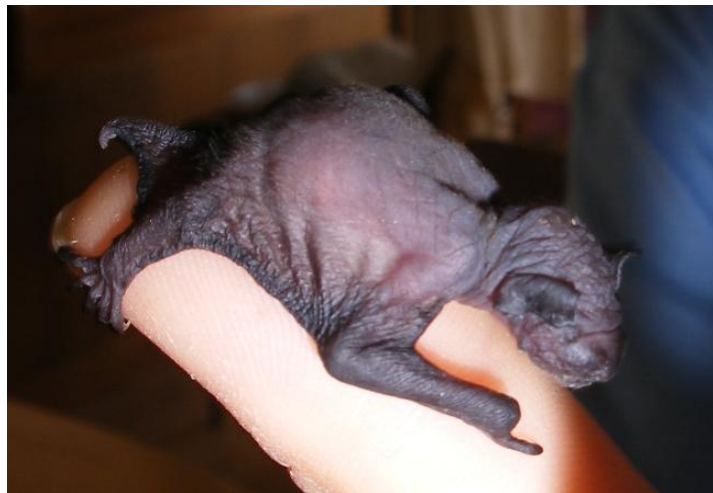
2 Tage alte Zwergfledermaus

Nach vier Tagen haben sie ihre Augen geöffnet und ein erstes Mal gwunderig in die Welt geschaut. Durch das regelmässige Schöpfeln mit Spezialmilch -alle 1 1/2 bis 2 Stunden - kennen sie mich nun schon ganz gut. Sie kommen sofort auf meine Hand, wenn ich sie ihnen hinhalte. Denn sie wissen, jetzt gibt es zu trinken!