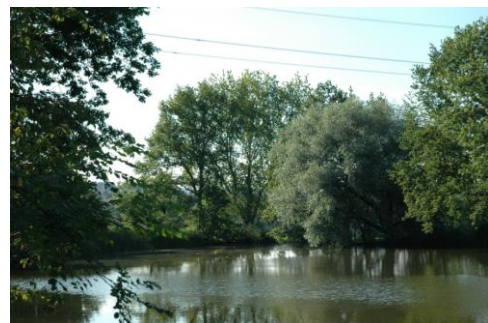
Jagdgebiet der Bartfledermaus

Eine weitere, mit der Wasserfledermaus verwandte Art, jagt mehr dem Ufergehölz nach, es ist die Bartfledermaus. Sie ist eine weitere sehr kleine Art. Ihr Jagdgebiet ist also zwischen Abendsegler und Wasserfledermaus zu finden. Über den Wipfeln fliegt der Abendsegler, unten, knapp über der Wasseroberfläche jagt die Wasserfledermaus. Dazwischen gefällt es der Bartfledermaus.