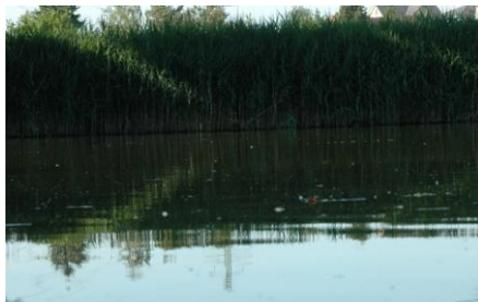
Jagdgebiet der Wasserfledermaus

Etwas später, wenn es dunkler ist, kommt eine Gruppe Wasserfledermäuse dazu. Sie jagt dicht über der Wasseroberfläche nach Insekten. Oft erwischen sie dabei Mücken, die knapp über der Wasseroberfläche fliegen. Auch erhaschen sie schwimmende Insekten wie Wasserläufer oder Rückenschwimmer.